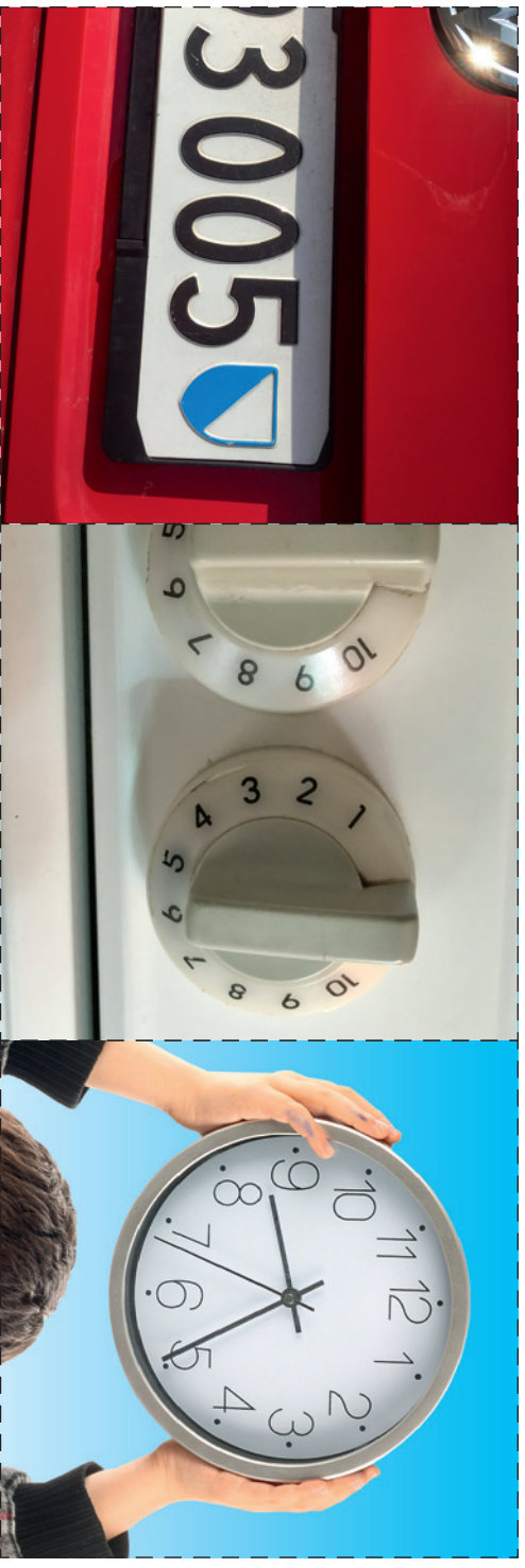
Zusatzbilder für Super-Pofis: Die Bilder sind ähnlich, aber nicht ganz genau gleich!